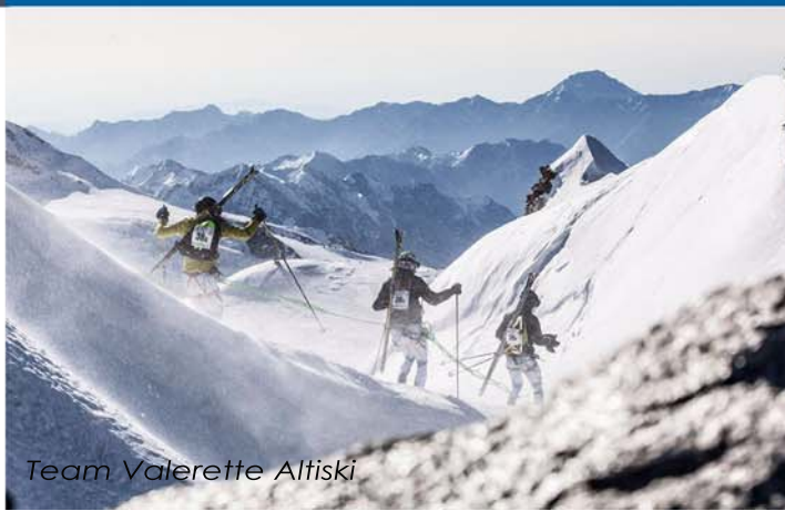
Team Valerette Altiski