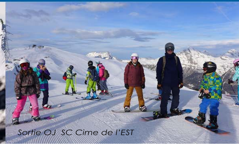
Sortie OJ SC Cime de l'EST