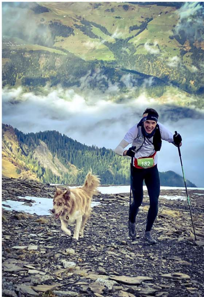
Arrivée à Tête de Chalin - 2022 - Pierre Meffan