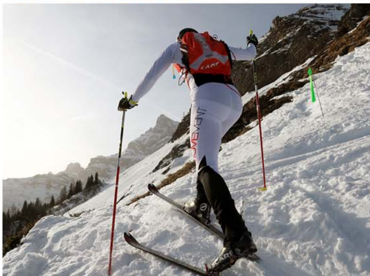
Course de jeunes / 2018