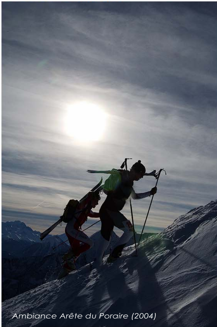
Ambiance Arête du Poraire (2004)