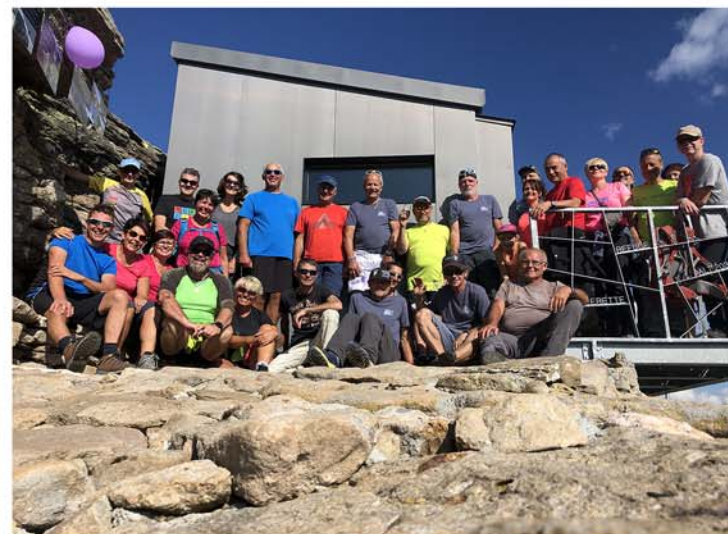
Pointe de Valerette

Le refuge de Valerette sera le fruit de plus de 2'000 heures de travail bénévole. Ce petit refuge est ouvert aux randonneurs, et est un atout supplémentaire et indéniable pour toute notre région.