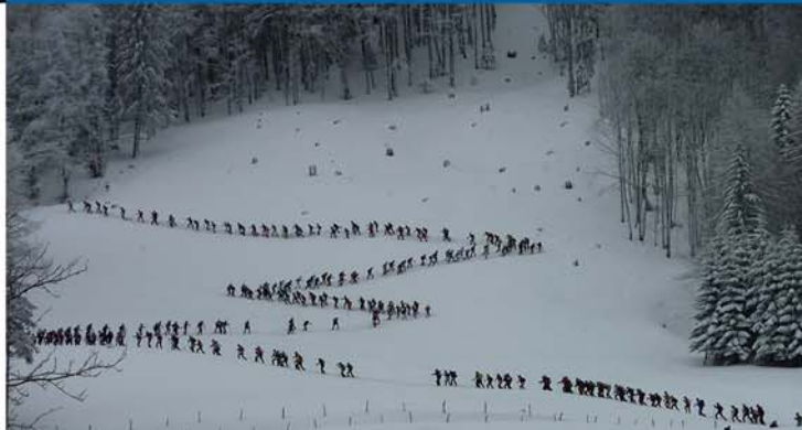
Départ à Vérossaz