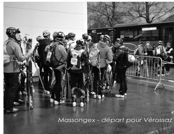
Massongex - départ pour Vérossaz

Tous les véhicules sont stoppés, près des sorties de l'autoroute, à Massongex . La grande salle du village y abrite toute l'intendance et de l'accueil (dossards, vestiaires, repas ...). De là, et c'est obligatoire, tout le monde est conduit au départ et reconduit en plaine par une flottille de cars des Transports Publics du Chablais. Calculés sommairement, ce sont quelque 8'000 km de voitures qui sont ainsi économisés.