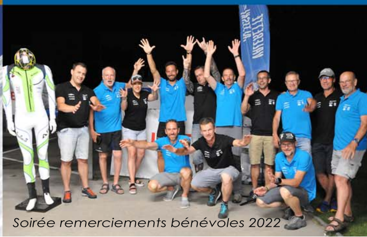
Soirée remerciements bénévoles 2022

VALERETTE ALTISKI course de ski alpinisme individuelle