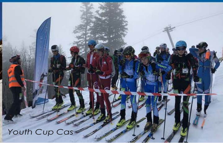
Youth Cup Cas