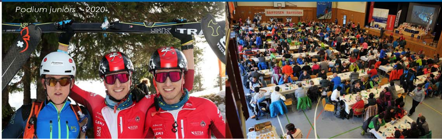
Podium juniors - 2020