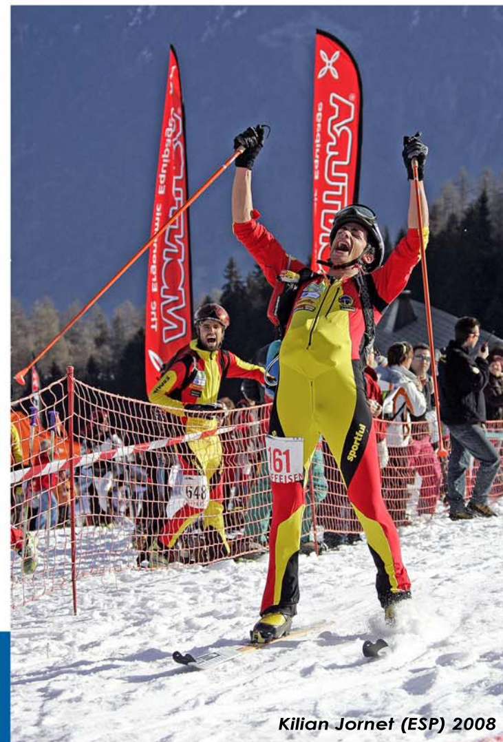
Kilian Jornet (ESP) 2008