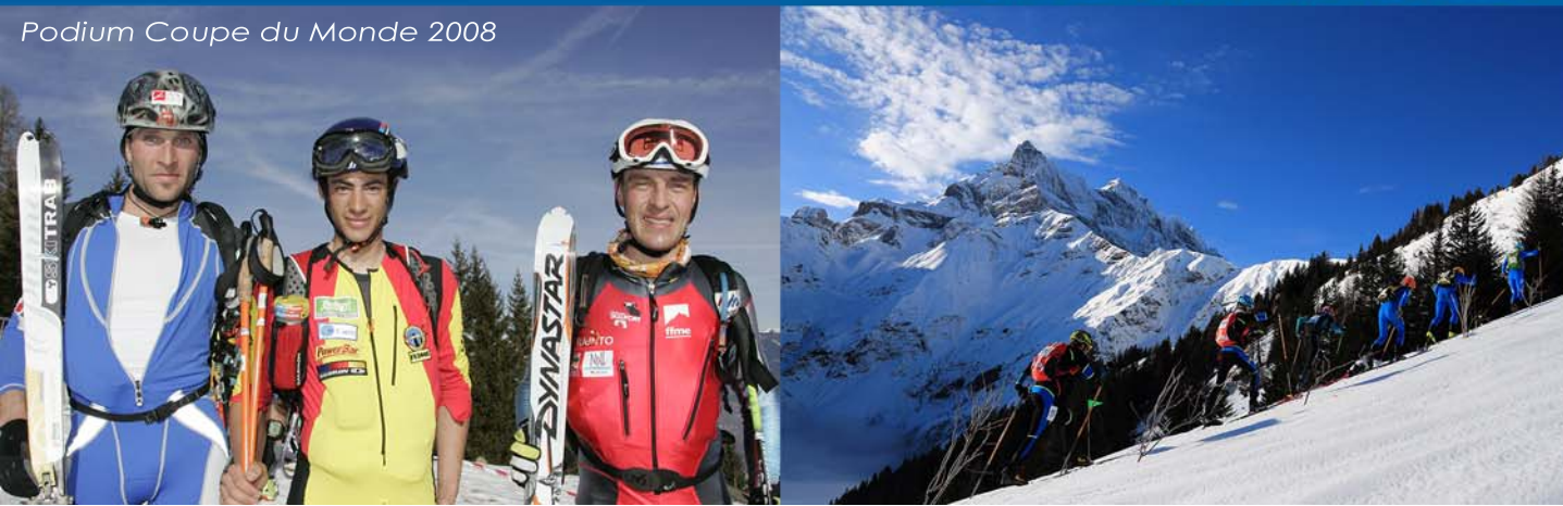
Podium Coupe du Monde 2008

VALERETTE ALTISKI course de ski alpinisme individuelle