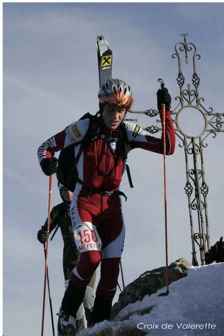
Croix de Valerette