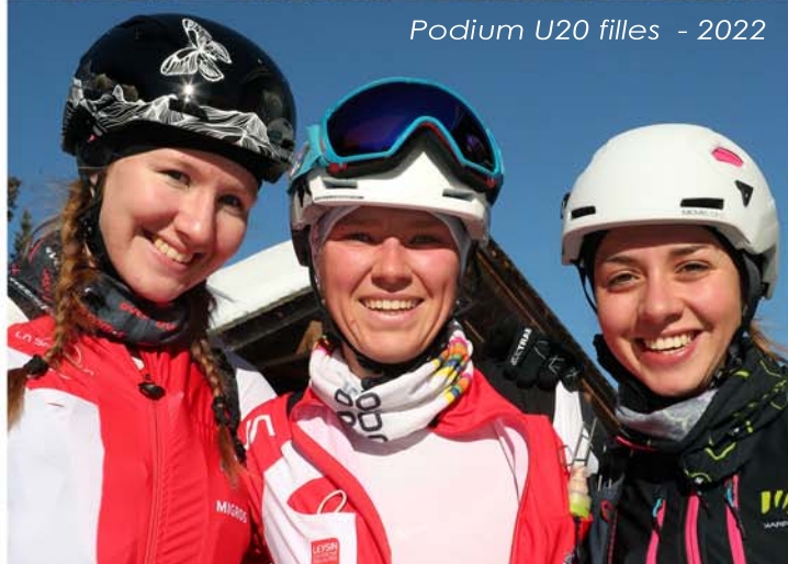
Podium U20 filles - 2022